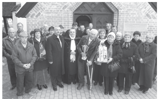
A református gyülekezet új tisztségviselői