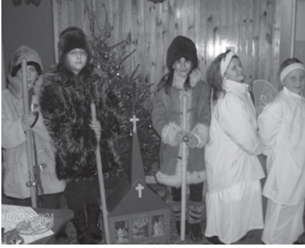
Szabad az Istent dicsérni

„A karácsony a gyerekek kedvenc ünnepe, mert megszületik a Kisjézus, és ilyenkor mindenki boldog és vidám. Tanulj meg egy szép éneket, csodaverset! Vegyetek fenyőfát, és öltöztessétek fel díszekkel és sok gyönyörű dologgal! Diszítsétek ki a házakat és a lelketeket is! Karácsonykor mindenki legyen boldog, vidám és szeretettel teli! Nagyszerű ünnepeket kívánok!”