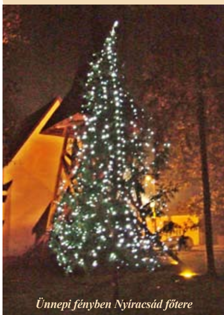
Ünnepi fényben Nyíracsad főtere

Szép Tündérország támad föl szívemben Ilyenkor decemberben. A szeretetnek csillagára nézek, Megszáll egy titkos, gyönyörű ígézet, Ilyenkor decemberben. ...Bizalmas szívvel járom a világot, S amit az élet vágott, Beheggesztem a sebet a szívemben, És hiszek újra égi szeretetben, Ilyenkor decemberben. ...És valahol csak kétkedő beszédet Hallok, szomorún nézek, A kis Jézuska itt van a közelben, Legyünk hát jobbak, s higgyünk rendületlen, S ne csak így decemberben.