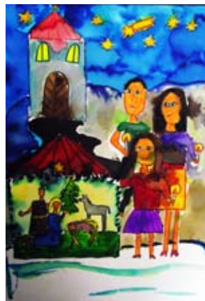
Karácsony éjszaka (Váraljai Virág 4. c)