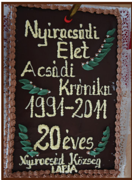
Az ünnepi torta

Nyíracshád havonta megjelenő közéleti újságjának első számát 1991 augusztusában vehették kézbe az olvasók. Szinte hónapra pontosan, 2011 augusztusában jelent meg a lap utódja, az Acsádi Krónika, mely megújult külsővel, új névvel, de változatlanul színes tartalommal igyekszik tájékoztatni a lakosokat. Azt hiszem ezzel lett igazán teljes, kerek és egész a Nyíracshádi Élet két évtizede. A lap fennállásának húszéves évfordulójára október 28-án egykori és jelenlegi szerkesztők, intézményvezetők, munkatársak, barátok emlékeztek.