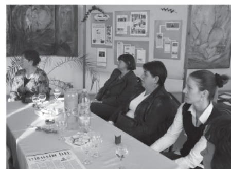
A vendégek egy csoportja