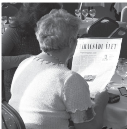
Az újság első lapszámát olvasva