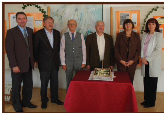
Egykori és jelenlegi szerkesztők az ünnepi tortával