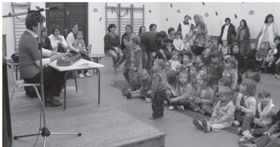
Az apróságok tátott szájjal hallgatták az előadást