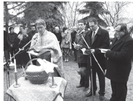
Ételszentelés húsvét vasárnapján a görögkatolikus templomban