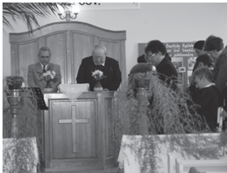
Énekes istentisztelet nagypénteken a baptista imaházban.