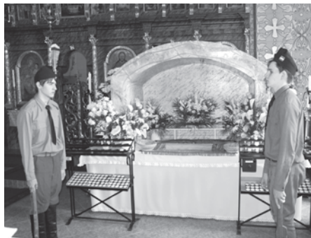
Krisztus-katonák a görögkatolikus templomban a szent sír előtt