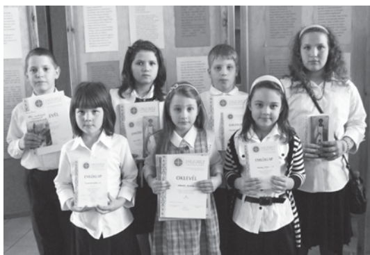
A versmondó verseny nyíracssádi résztvevői