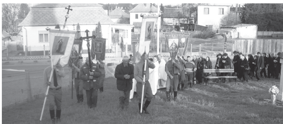
Feltámadási szentmise körmenettel nagyszombaton a római katolikusoknál