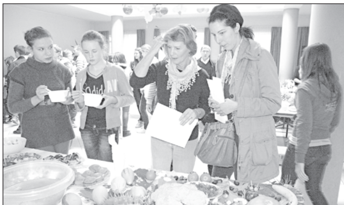
Munkában a zsűri