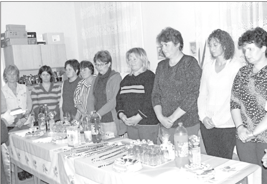
Az ünnepség megható pillanatai