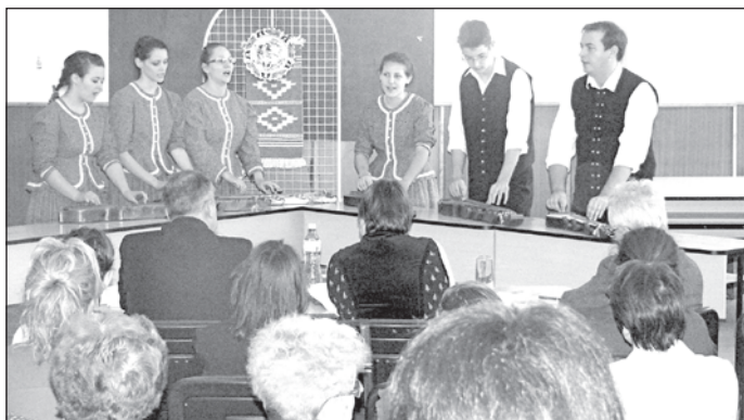
Az ifjúsági citera együttes