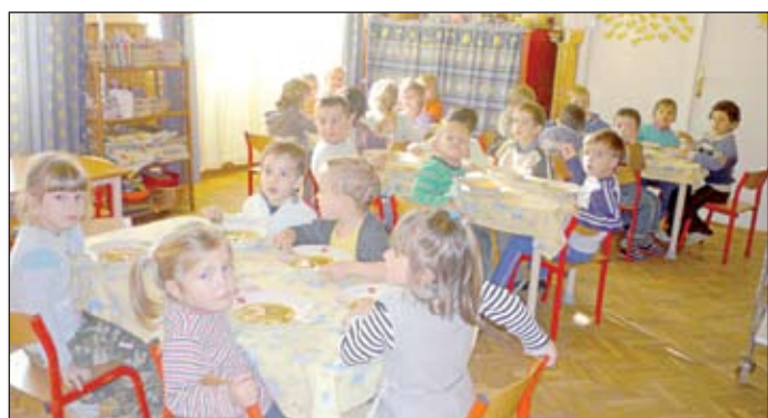
Az óvodások ebédje helyben termelt alapanyagból készül