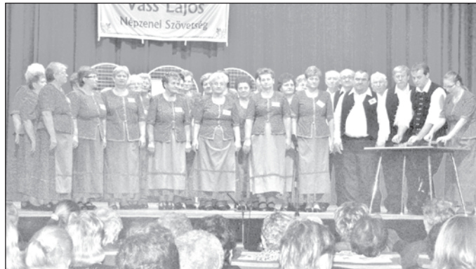
Színpadon a népdalkör...