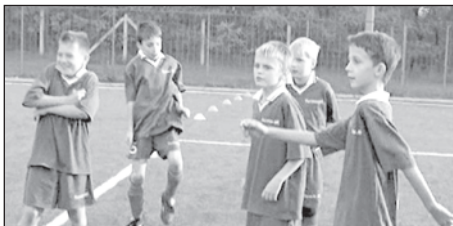
Melegítés meccs előtt

Minden évben részt veszünk a körzeti labdarúgó diákolimpián, ahol több korcsoportban is érdekelték vagyunk.