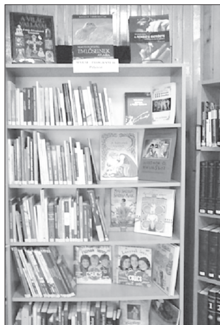
Polcokon a Márai-könyvek