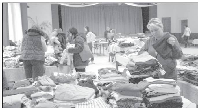
Sok babaruha cserélt gazdát