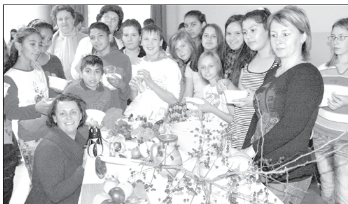
Díszes asztalok, ízletes finomságok