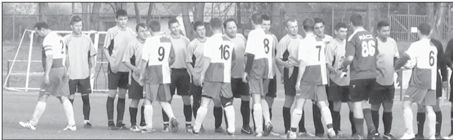
A Nyíracsad-Nyirábrány összecsapás előtt