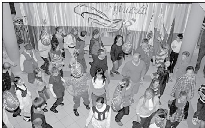
A külföldiek érdeklődéssel tanulták a magyar tánc lépéseket