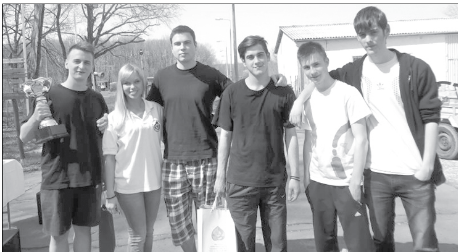
Nemcsak a fiúk, de felkészítőik is jelesre vizsgáltak

Az idei katasztrófavédelmi ifjúsági verseny megyei döntőjén a nyíracádi Lendület Egyesület csapata első helyezést ért el. A versenyt április 18-án rendezték Hajdúszoboszlón. A csapatnak 17 állomást kellett teljesítenie. Számot adtak többek között tűzvédelmi, árvízvédelmi, elsősegély nyújtási ismereteikről.