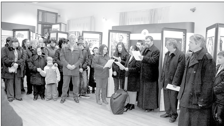
A kiállítás megnyitóján