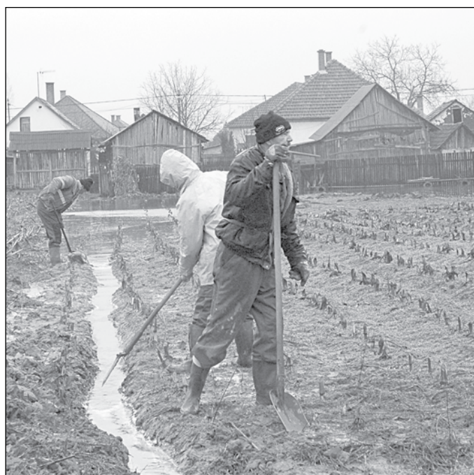
A belvizet kézzel vájt árkok ásásával vezették a csatornába

Márciusban hó, április elején belvíz okozott fejtörést Nyíraczádon – az önkormányzat pályázati segítségre vár. A március végi havazás, valamint az április elején lezúduló szokatlanul nagy mennyiségű eső komoly gondokat okozott belvízfronton településünkön.