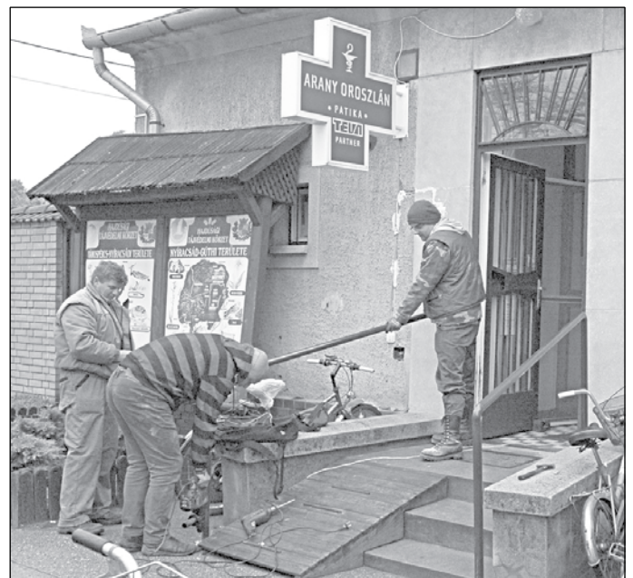
Elkészült a korlát