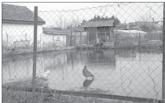
A tyúkok vízben kapirgáltak

– Az esőzések okozta belvízhelyzet sok helyen azonnali intézkedést igényelt. A szivattyúzás, a szikkasztó árkok ásása csupán tűzoltás volt, de nem ez a végleges megoldás. Ezért már 2011-ben pályázatot nyújtottunk be, amit első körben sajnos elutasítottak. Önerőből pedig ekkora beru-