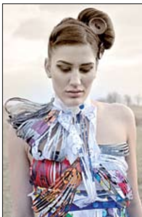
A látványruha sorozat egyik modellje

avatkozást: kommunikáció a gomb, az alkotó felület és a ruha viselője között.