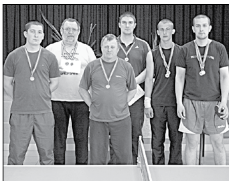
A felnőtt kategória helyezettei