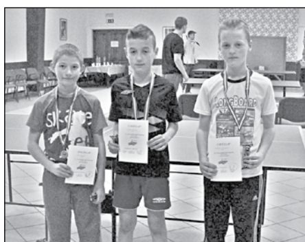
A legügyesebb ifi pingpongosok