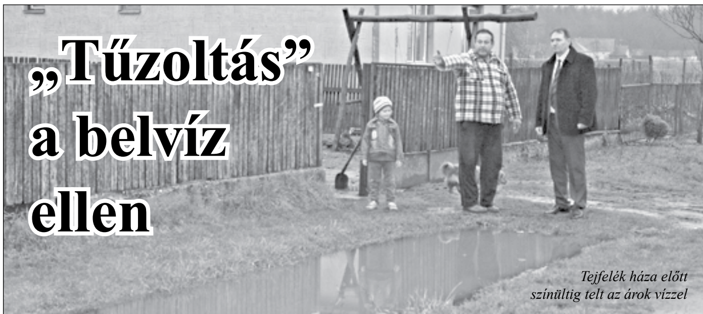
Tejfelék háza előtt szüntig telt az árok vízzel

Márciusban hó, április elején belvíz okozott fejtörést Nyíraczádon – az önkormányzat pályázati segítségre vár. A március végi havazás, valamint az április elején lezúduló szokatlanul nagy mennyiségű eső komoly gondokat okozott belvízfronton településünkön.