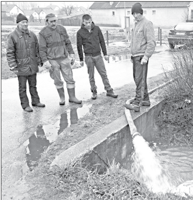
A szivattyúzás sokat segített a helyzeten

Tejfel Sándorék utcájában szinte minden kert víz alatt állt. A ribizli ültetvény mintha csak rizsföld lett volna, a tyúkok vízben kapirgáltak, a szomszéd kertben meg csak