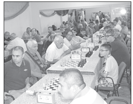
Csaknem negyvenen ültek táblához