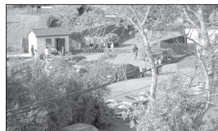
A jelenlegi piac madártávlatból