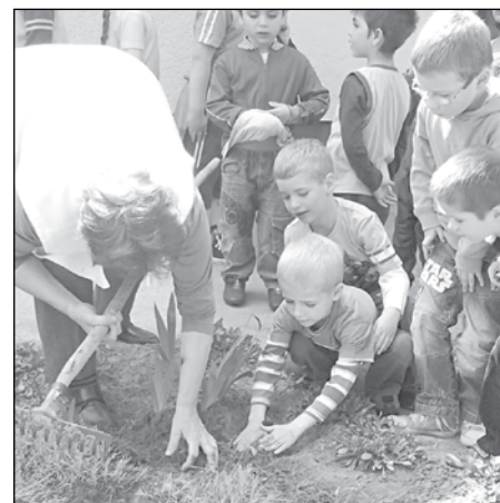
A Föld napján virágot ültettek

A madarak és fák napján, május 10-én madarak köszöntöttek az óvodába érkező gyerekeket, színes origami madarak a fákon, és madáracsicscsergés, madarakról szóló dalok hangzottak a CD-ről. Amíg a madarakat hallgattuk, színeztünk, rajzoltunk, hajtogattunk, zászlókat készítet-