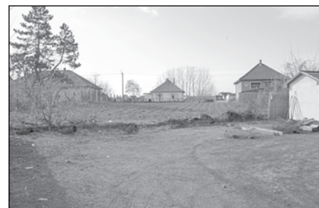
Az új piactér helye