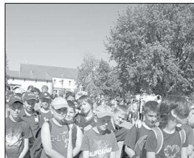
Az acsádi kisdíákok a templomba való bebecsátásra várnak