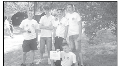
Ők voltak a legfelgyelmezettebbek!