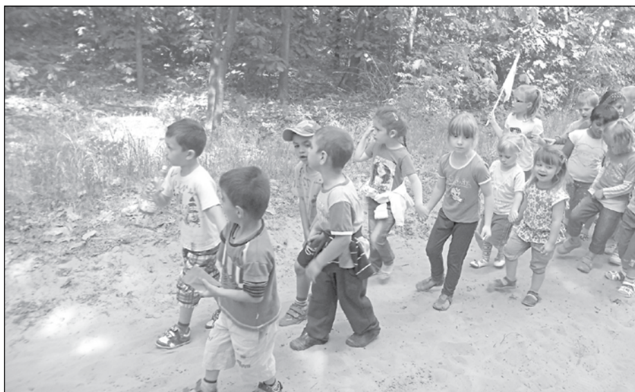
A madarak és fák napján kirándultak

tünk. Tízórai után meghallgatták a gyerekek az óvó nénik kórusát, majd valamenyien együtt énekeltünk, mondókáztunk a madarakról. Ez után a zászlókat lengetve együtt kísértünk a közeli kiserdőbe, hogy meghallgassuk az erdei madarak