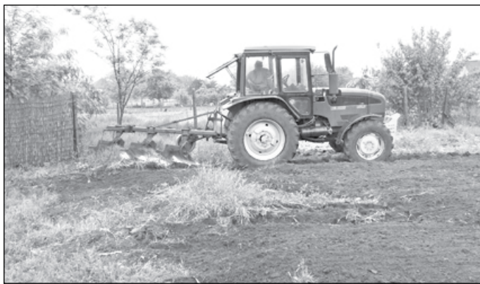
Munkában az új traktor