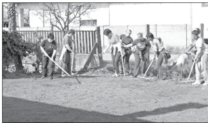
Talajelőkészítés a dughagyma számára