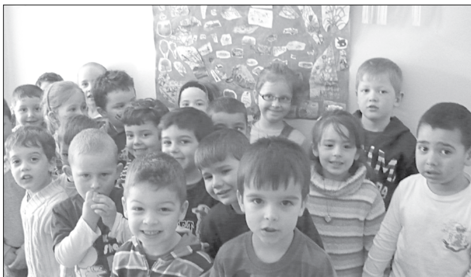
A víz világnapján rajzoltak, festettek

énekét. Út közben szívesen emlékeztünk vissza madaras élményeinkre: az óvoda fenyőin telelő baglyokra, a téli madáretezésre, a sokféle színes tollú madárra, és a parkban tett sétákra, ahol számlálgattuk a baglyokat. Az erdőben mi is együtt füttyültünk a madarakkal.