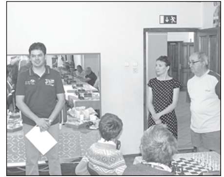
A versenybíró ismerteti a szabályokat