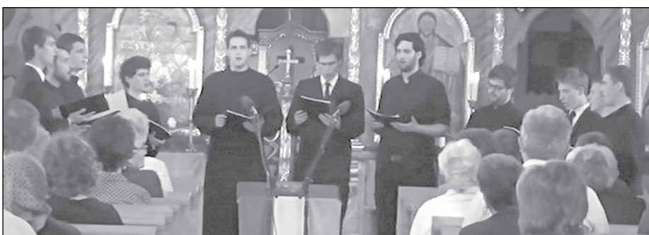
A Szent Damján kórus hangversenye a templomban