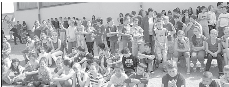
A gyerekek élvezték a tűzoltó-bemutatót