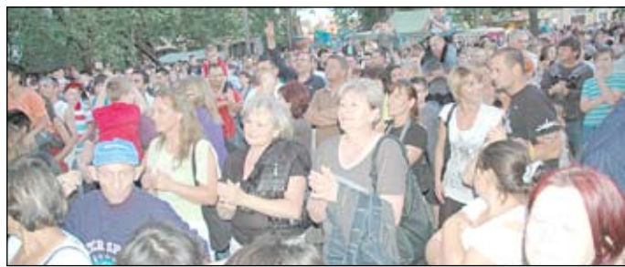
Délután sokan, este pedig rengetegen voltunk a falu főterén