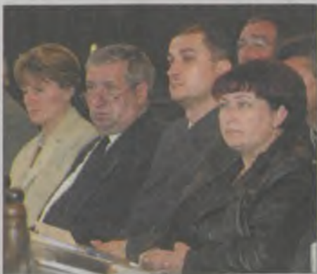
Tisztújításra gyűltek össze

A Vöröskereszt megyei vezetőségének beszámolóit letölthetők a Hajdú Online portáljáról (719 és 180 KB).