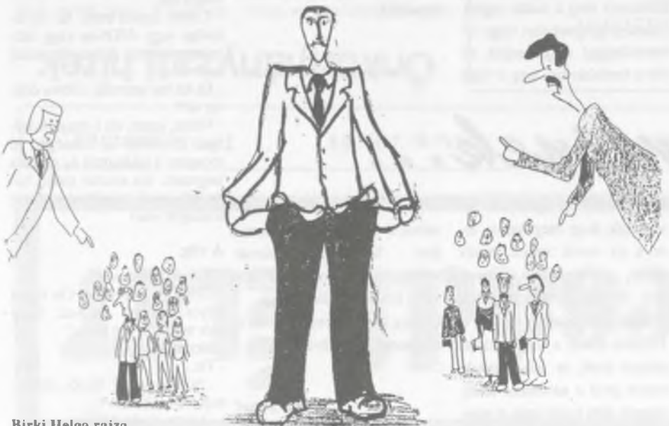
Birki Helga rajza