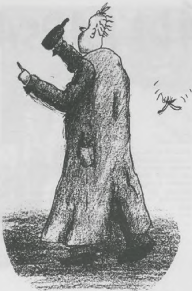
Birki Helga: Farsangi szesztestvér