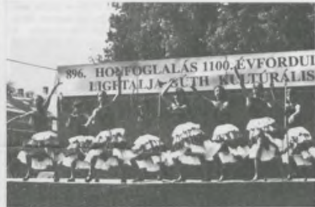
„Szamba” a nyíracsaádi sportgimnasztika csoport előadásában