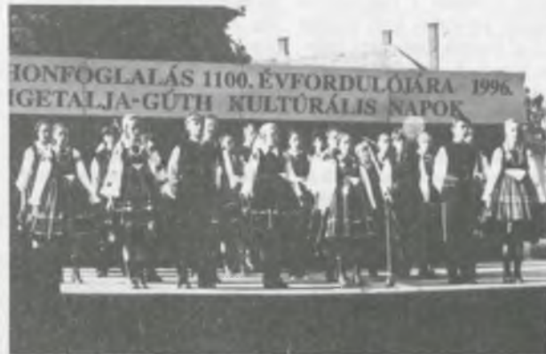
A lengyelországi Boozky Chelmonsky népitánc-csoport