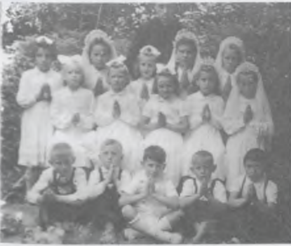
Elsőáldozási kép 1957–58-ból Nyírcsádon.