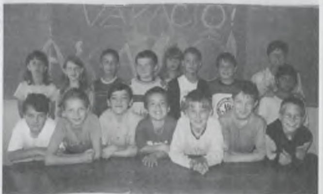
Sok-sok szeretettel: a 4. a osztály