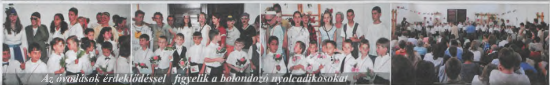
Az óvodások érdeklődéssel figyelik a bolondozó nyolcadikosokat