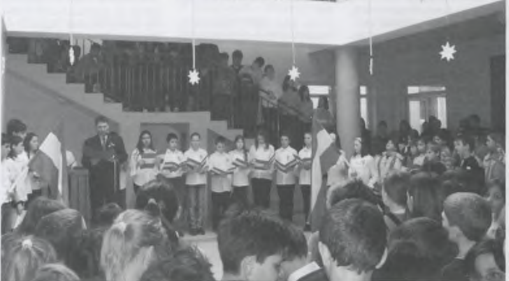
Március 15-i ünnepi megemlékezés az iskola új aulájában

„A mai nemzedéknek nehéz elképzelni azt az időt, amely Magyarországon 1848-49-ben történt, hisz már nem él senki a földön, aki beszélt volna olyan emberrel, aki megérte, átélte azt a március 15-ét. Az utolsó '48-as honvédet az 1900-as évek elején kísérte örök nyugalomra a nemzeti kegyelet, s ezt követően már csak a nemzeti történelem hűségére hagyatkozhatunk.