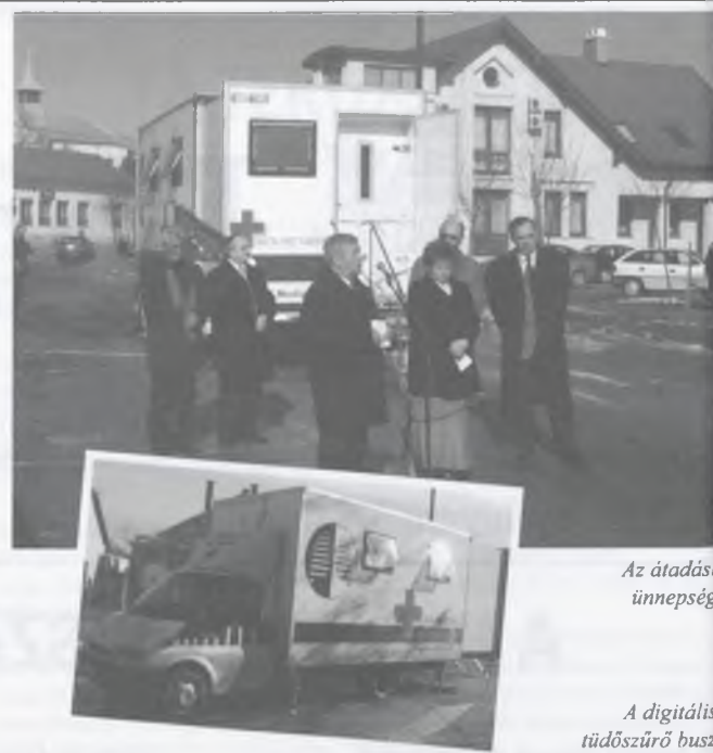
Az átadási ünnepség

megye lakosságának szűrése, nyilvánvalóan bővíteni kellett a szűrési kapacitást. Ezért döntött úgy a megyei önkormányzat és a Kenézy kórház, hogy a megye lakossága életminőség-javítása érdekében, a szűrőbusz megkezdésének megfelelően pályázatot nyújt be egy új tüdőszűrő busz üzembe állítására. Hölgyeim és Uraim! Az ügy fontosságát felismerve a megyei területfejlesztési tanácsa a céljellegű decentralizált alapról 40 millió forinttal támogatta ezt a beruházást, amely kétségtelenül jelentős előrelépés a vidéken élők életminőségének javításában. Mert nyilván az is fontos, hogy egy-egy tüdőszűrő vizsgálat miatt ezután nem kell Debrecenbe buszozni, vagy három évet várni. De még fontosabb az, hogy talán többeknél, talán sokaknál megelőzhetővé válik a rendszeres szűrővizsgálattal a komolyabb tüdőbetegségek kialakulása. Márpedig, ha csak egyetlen ember életét sikerül megmenteni egy-egy betegség korai felismerésével, már sokszorosan is megtérült ez a majdnem 60 millió forintos beruházás. Én kívánom azt, hogy ez a busz – sarkítva persze – a nap minden órájában és az év minden napján