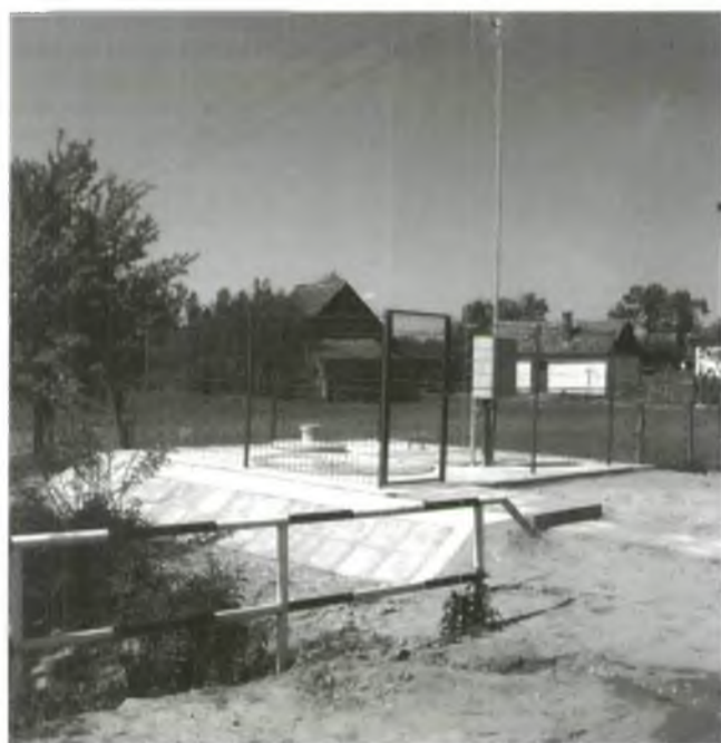
Átemelő a Sztármári utcán

A szennyvízhálózat kiépítése befejeződött községünkben. A műszaki átadás és átvétel megtörtént. Rövidesen megkezdődhetnek a hálózatra való rácsatlakozások.