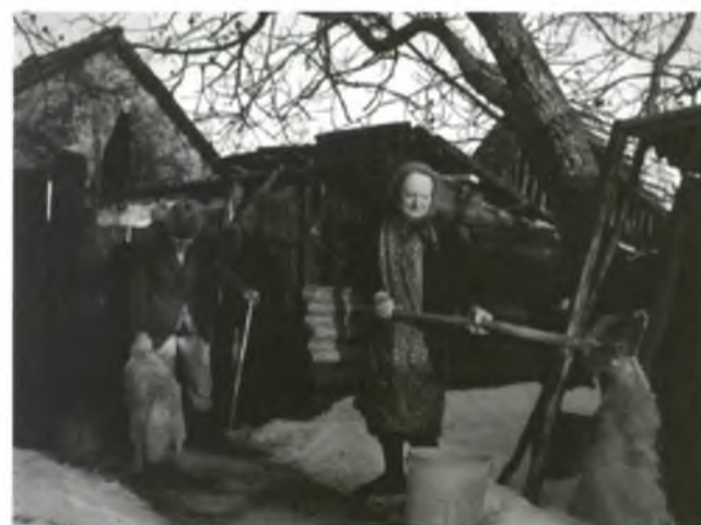
A Konyári házaspár

Egyszer egy héten Mező atya hitoktatást tart a gyerekeknek. A többi felekezet is szervez hittanórákat. Nem kötelező, de ez egy