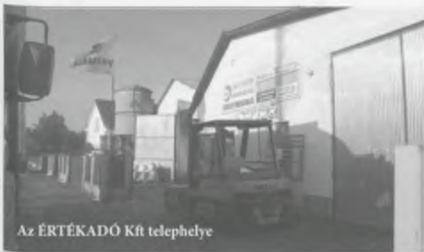
Az ÉRTÉKADÓ Kft telephelye