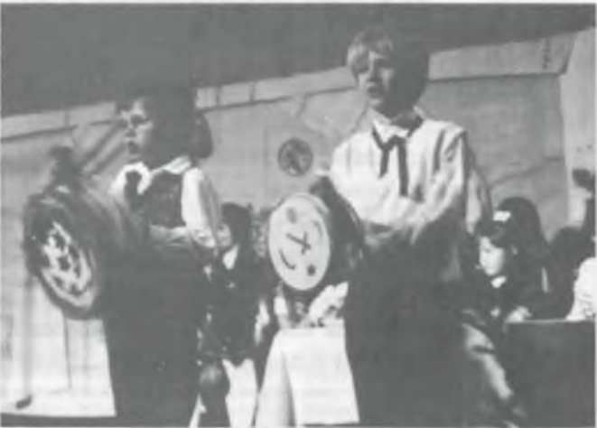
Pereg a rigmus az óvodások száján, s a kezük sem pihen