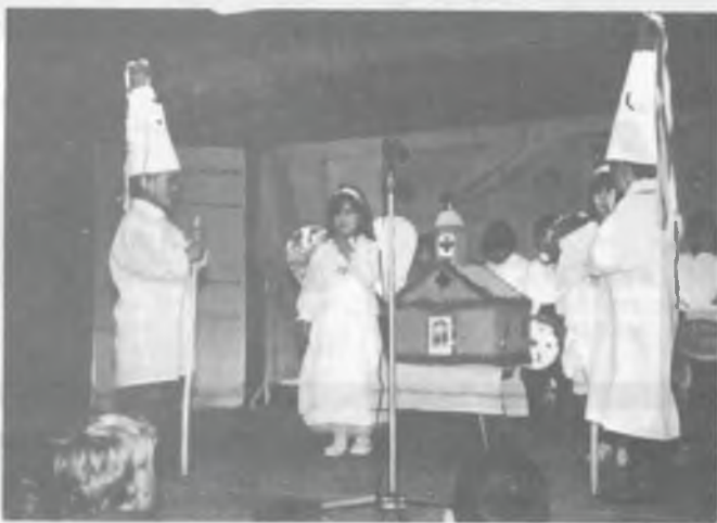
A bethlehemzés ma is élő hagyomány Acsádon, de az országban máshol is