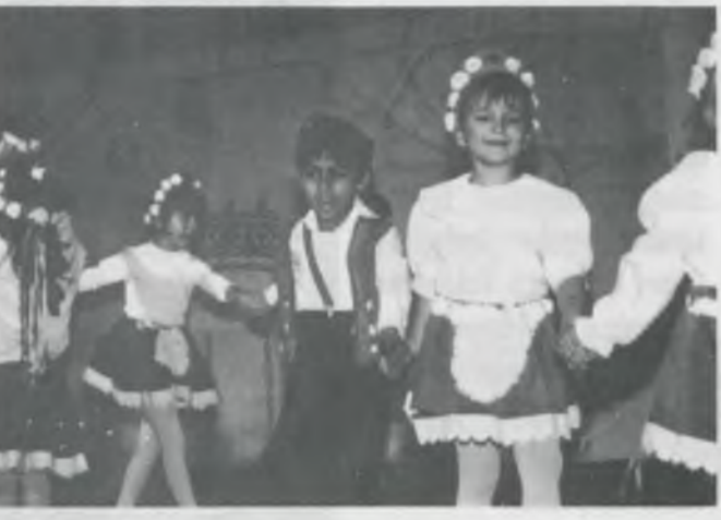
Körbe, körbe, karikába, avagy lássuk ki áll a körbe, lássuk kit szeret a legjobban