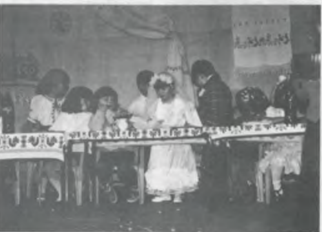
Menyasszony és vőlegény, s a tisztelt násznép az asztal körül