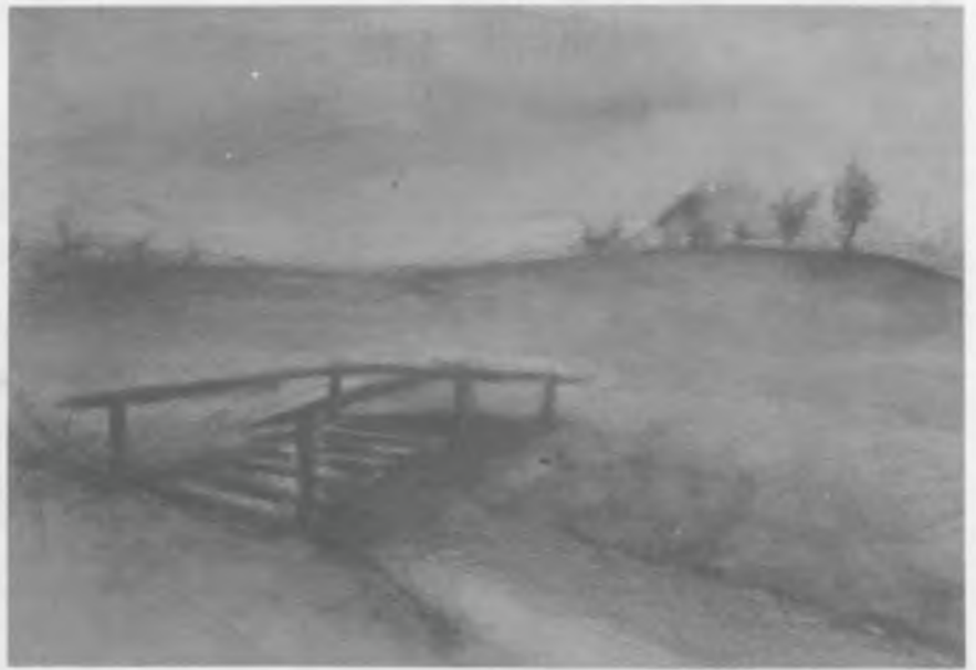
Dorogi János: Bihari táj