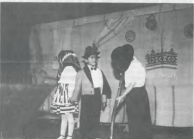
Nem fejtlenység, figyelem, mert a kapanyél is fontos szerszám