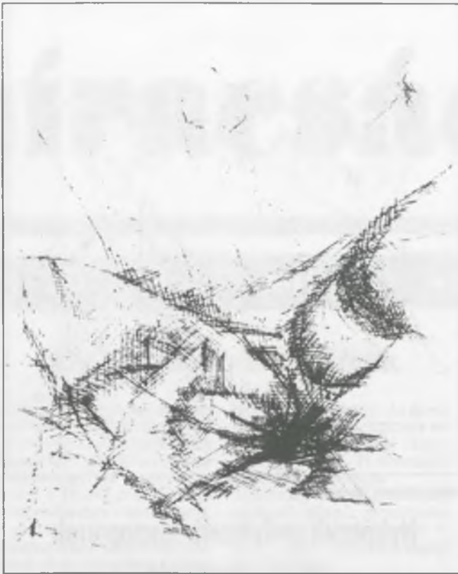
Kliss József: Vénusz születése

A legtöbb gondot a faluban az okozza, hogy az anyák kevés ideig szoptatnak, illetve az első alkalommal, mikor úgy érzik, hogy kevés az anyatej, pótláshoz nyúlnak, ami az esetek kb 80%-ában tehéntej. Tudni kell, hogy az anyatej-termelés nem mindig