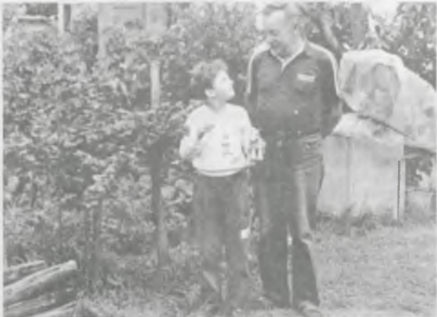
Nagyapa és kedvence