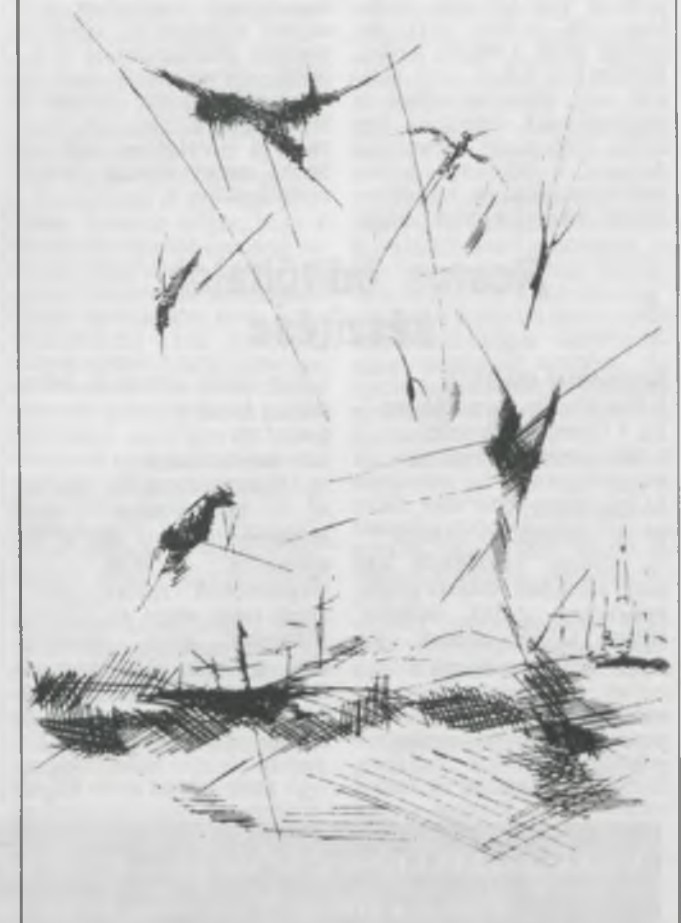
Kliss József: „Madarak”