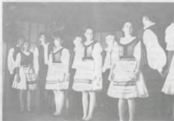
A néptánc-együtt is az elsők között lépett fel