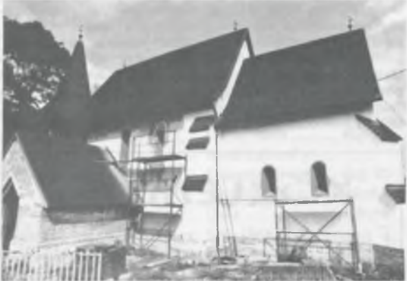
Képünkön: A templom építés közben