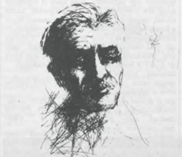
Dorogi János rajza