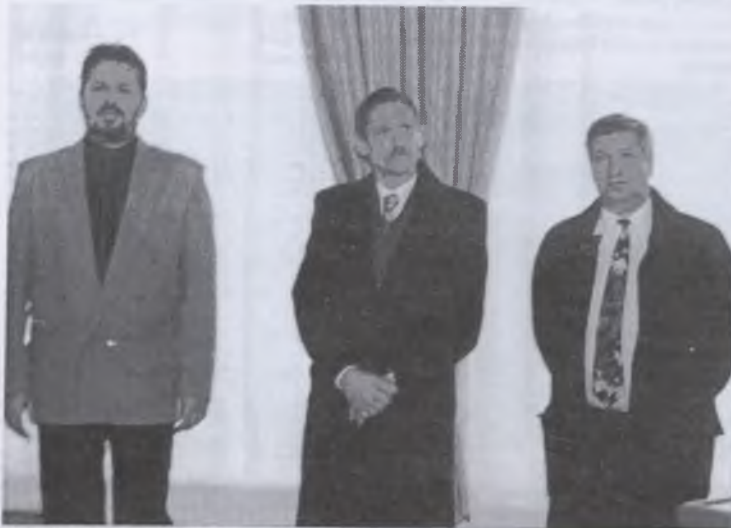
A festőművész, a belügyminiszter és a polgármester