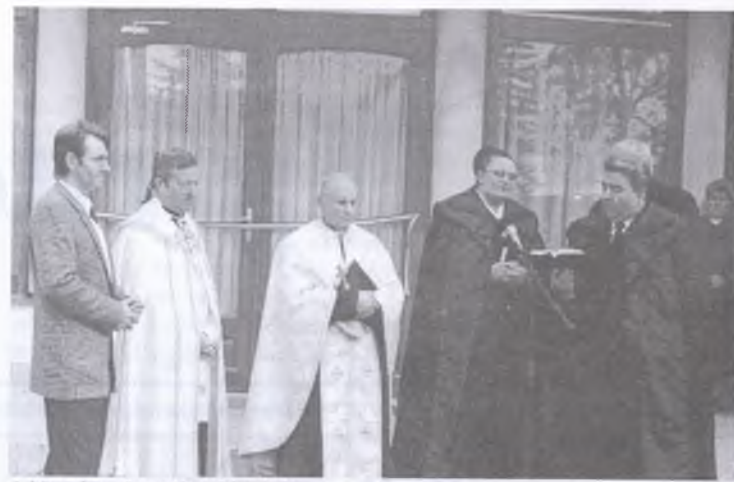
A községháza ünnepélyes felszentelése

hogy az új beruházás összköltsége 80 millió forint volt, melynek felét privatizációs bevételből fedezték. Jelentős támogatást nyújtott a Hajdú-Bihar megyei Területfejlesztési Tanács is. Az épületet China Tibor debreceni műépítész tervezte, az építkezést a helybeli Hudi-Ép Kft. kivitelezte. Az avatást követően azt is megtudtuk, hogy a régi községházában Nyíraczádi, illetve a Dél-Nyírségi helyörtöneti múzeumát szeretnék berendezni, s ez újabb turisztikai vonzerőt kölcsönözne a térségnek.